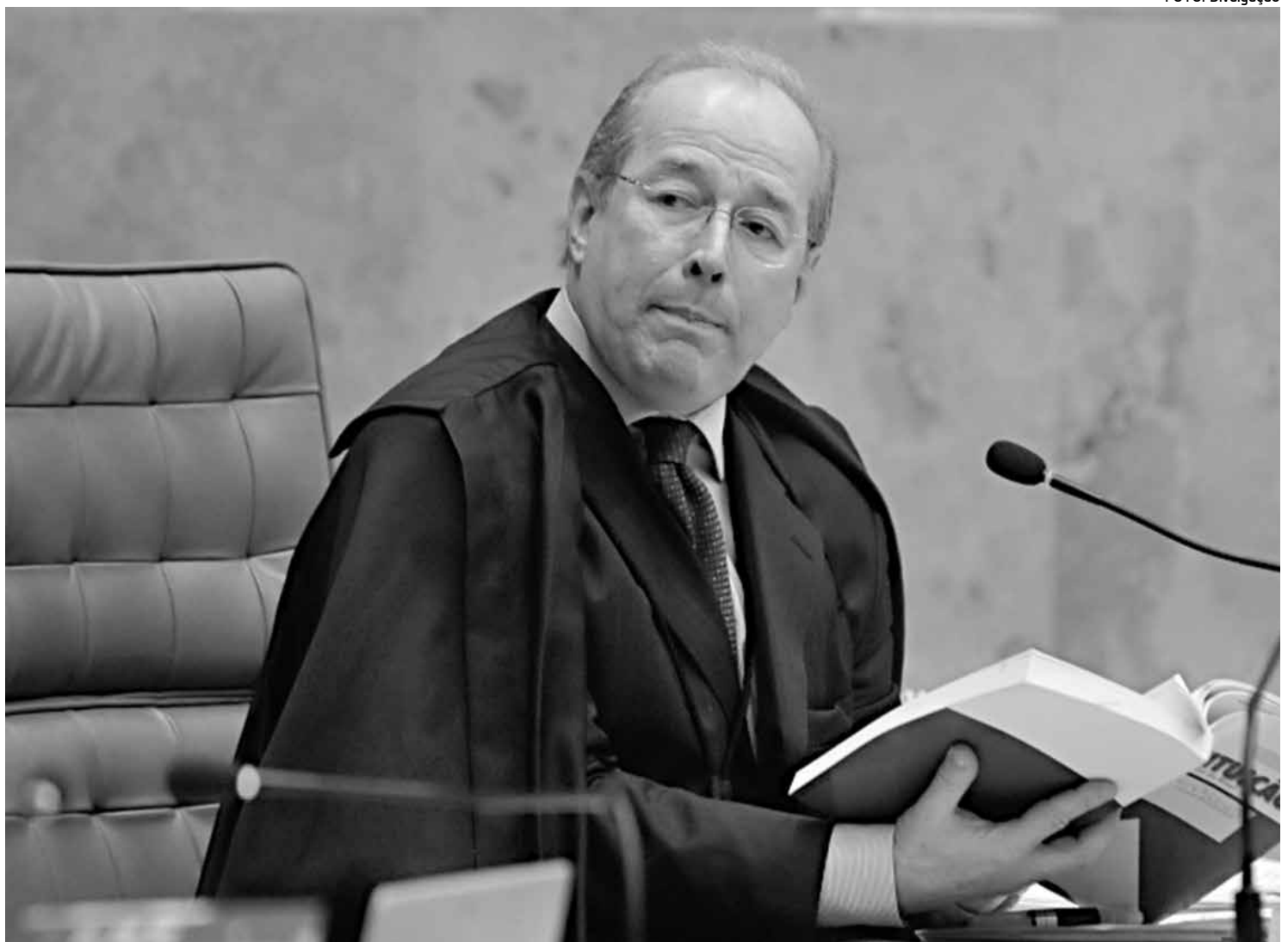
Último ministro a votar, Celso de Mello, que estava doente, aderiu à tese de que a decisão final sobre a perda de mandato é do STF

No início do voto, Celso de Mello defendeu também que o presidente do STF e relator do processo, ministro Joaquim Barbosa, seja o responsável pela execução das penas dos réus, sem delegar a função para juízes de instâncias inferiores.