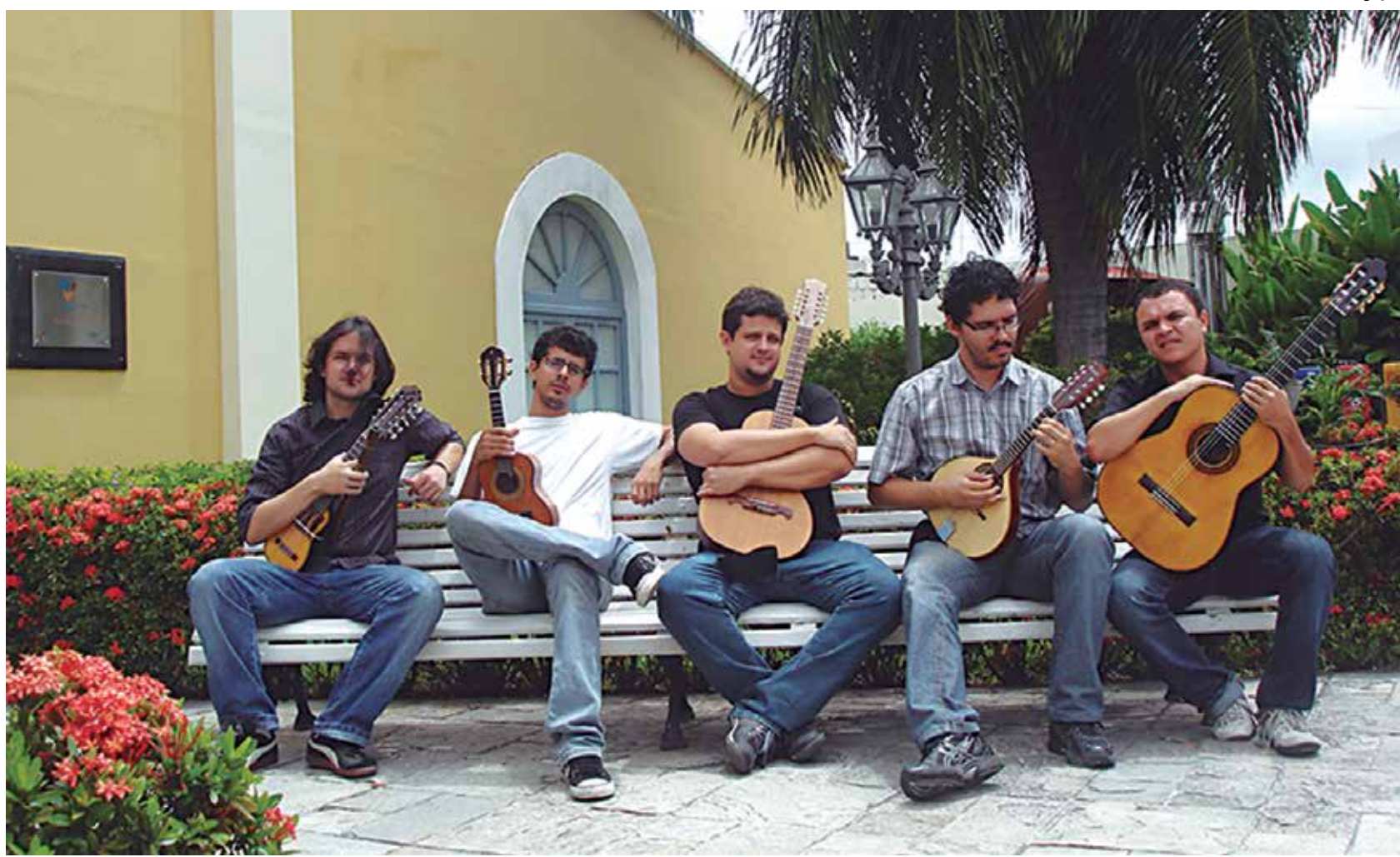
Fundada este ano, a Camerata Filipeia faz sua apresentação de estreia no Projeto Violadas com um repertório diversificado

“No ano passado, fiz uma apresentação especial e estava com ideia de repeti-la. Mas o problema é que ficamos na dependência das pessoas, da agenda de cada um. Conversando com outros colegas meus, tivemos essa ideia do grupo de câmara. Era uma ideia que já existia, mas que decidimos realizá-la. Unir instrumentos de cordas dedilhadas e fazer