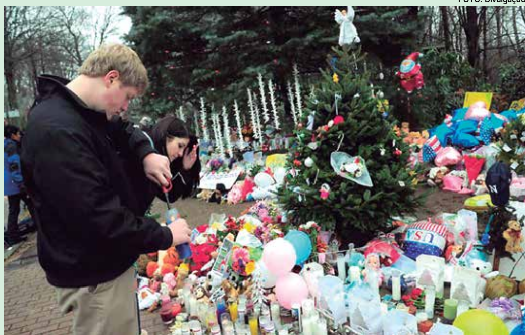
Visitantes prestaram homenagem às vítimas do massacre da escola em Newtown, nos EUA

O anúncio das construções não foi a única represália anunciada por Israel. O governo do Estado judeico ainda anunciou que não vai repassar US$ 100 milhões (R$ 213 milhões) em impostos da Autoridade Nacional Palestina (ANP), em novembro. O valor é a metade do orçamento palestino.