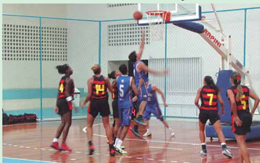
Com algumas atletas da Seleção Brasileira, o Sport-PE foi surpreendido pela Ansef

Quem esperava uma vitória fácil por parte do time pernambucano voltou para casa desapontado. Em todos os períodos da partida a Ansef se manteve a frente no placar. No fim do primeiro período, o placar marcava 20 a 18 para a equipe de João Pessoa. No segundo período, Ansef à frente novamente, com