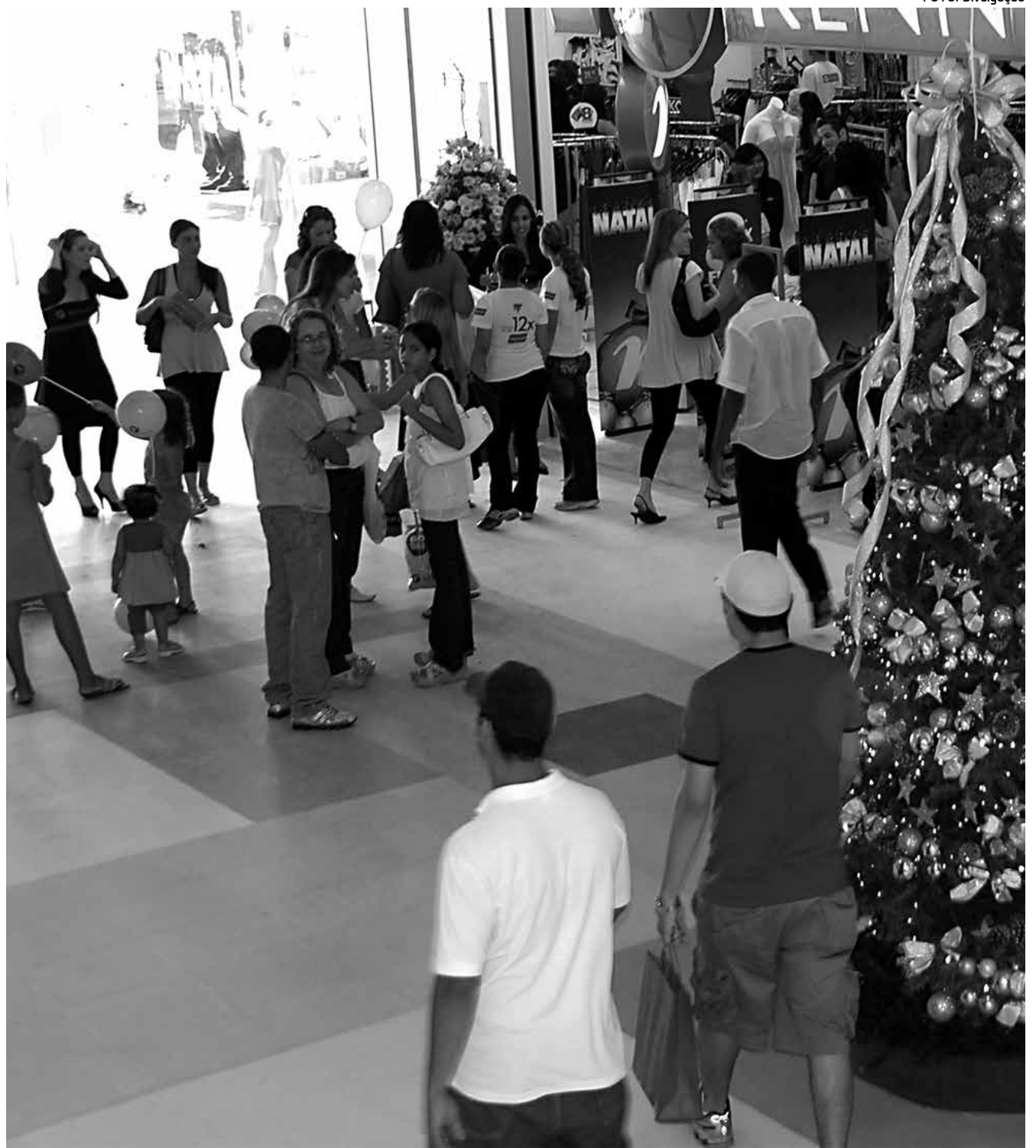
Na maioria das vezes, compras de última hora no comércio varejista deixam os consumidores superendividados

Outro problema comum é em relação à troca de mercadorias. O consumidor faz muita confusão e pensa que tem o direito de trocar o presente. Na verdade, o Código de Defesa do Consumidor prevê a troca de produtos no prazo de sete dias quando a compra é indireta. Nesses casos, a recomendação é que o consumidor pode desistir da compra. Caso ele tenha ido à loja e comprado o presente e depois se arrepender, a regra não vale. A exceção é se existir defeito ou se a regra da loja é de efetuar a troca. Mas o procedimento não é obrigatório. "O que muitos lojistas fazem é um pacto de cordialidade, em busca de fidelidade do cliente, porque sabem que a pessoa que ganhou o presente, ao trocá-lo, pode se interessar por mais um produto da loja", explica. Eletrodomésticos e eletroeletrônicos, se comprados com defeito, não devem ser levados à loja. O produto deverá ser encaminhado à assistência técnica e, caso os técnicos não repararem em 30 dias, o consumidor terá a possibilidade de trocar.