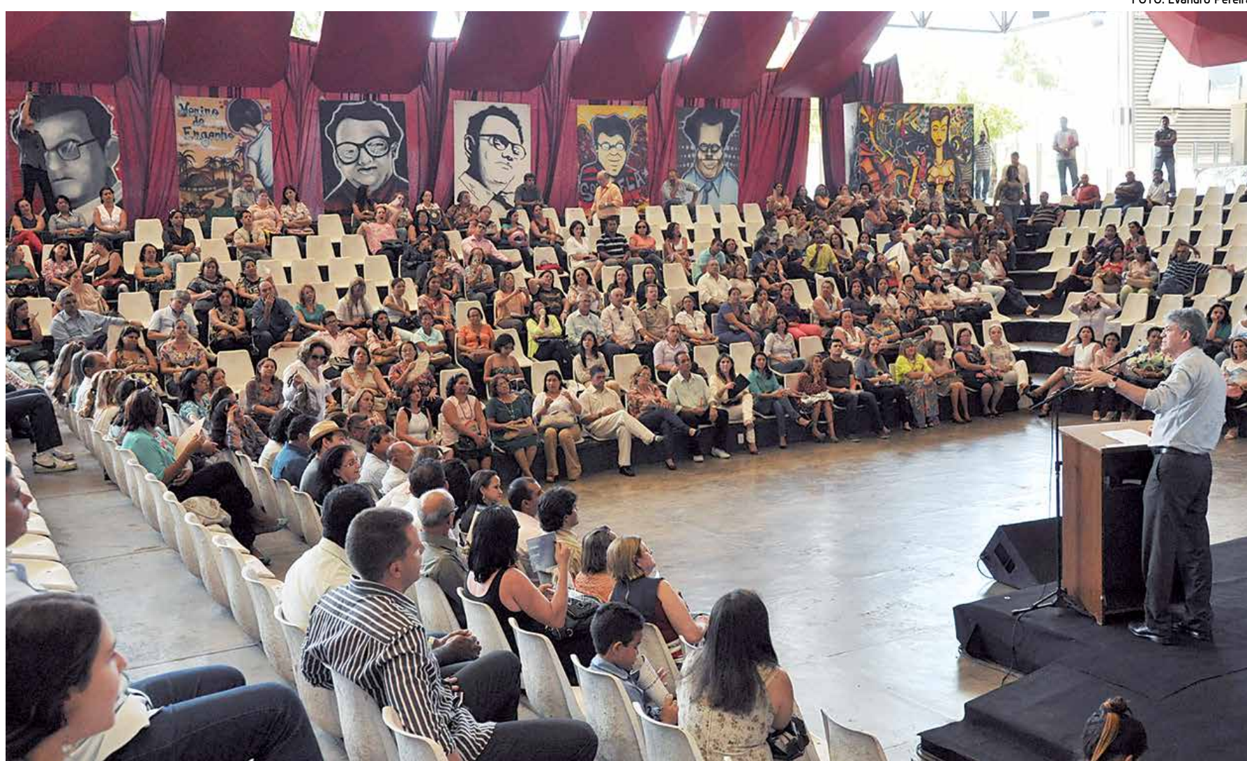
Premiação foi anunciada durante solenidade no Teatro de Arena do Espaço Cultural com a presença de funcionários da Educação