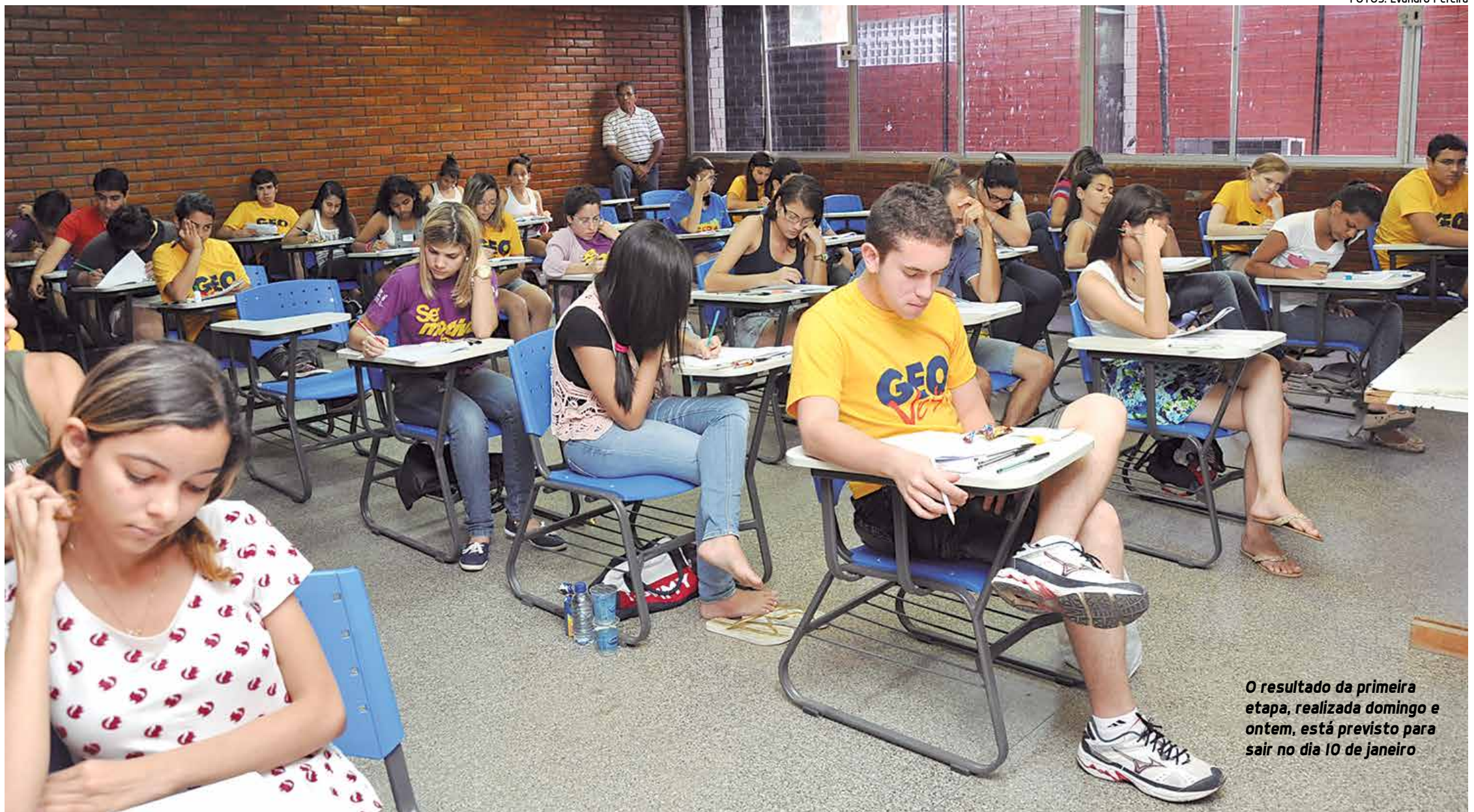
O resultado da primeira etapa, realizada domingo e ontem, está previsto para sair no dia 10 de janeiro