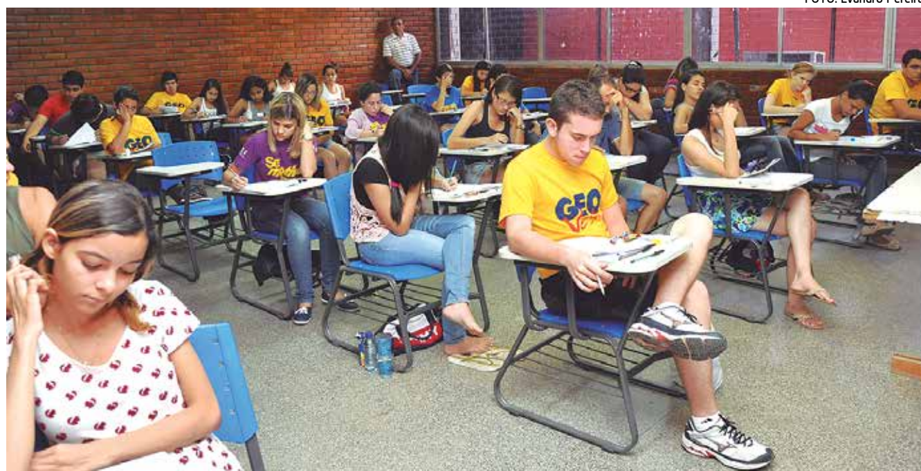
Candidatos que se inscreveram para tentar uma vaga na UFPB concluíram ontem a primeira etapa do concurso