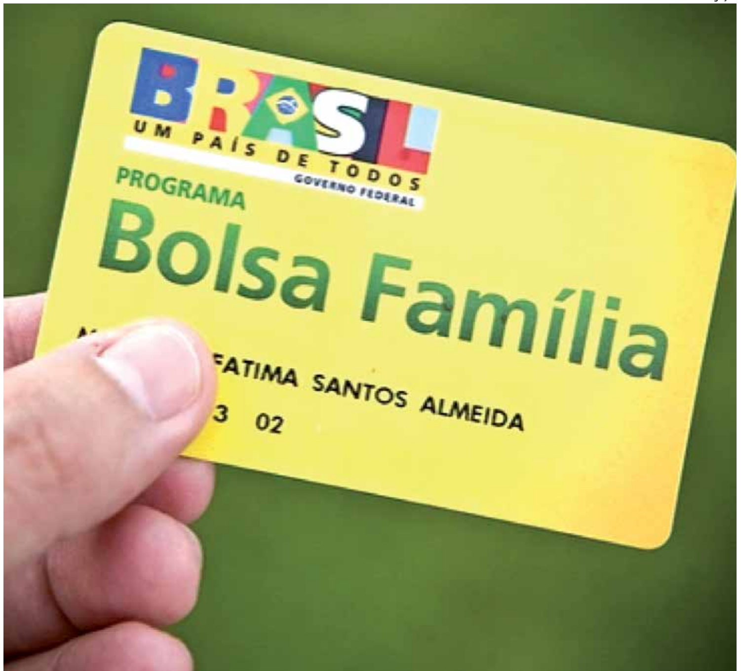
Quase 60% das famílias paraibanas são beneficiárias do Bolsa Família e vão receber o abono natalino do Governo do Estado

O valor unitário do abono família que será pago é de R$ 32,00, e os recursos para o pagamento do benefício serão de R$ 16.113.952,00