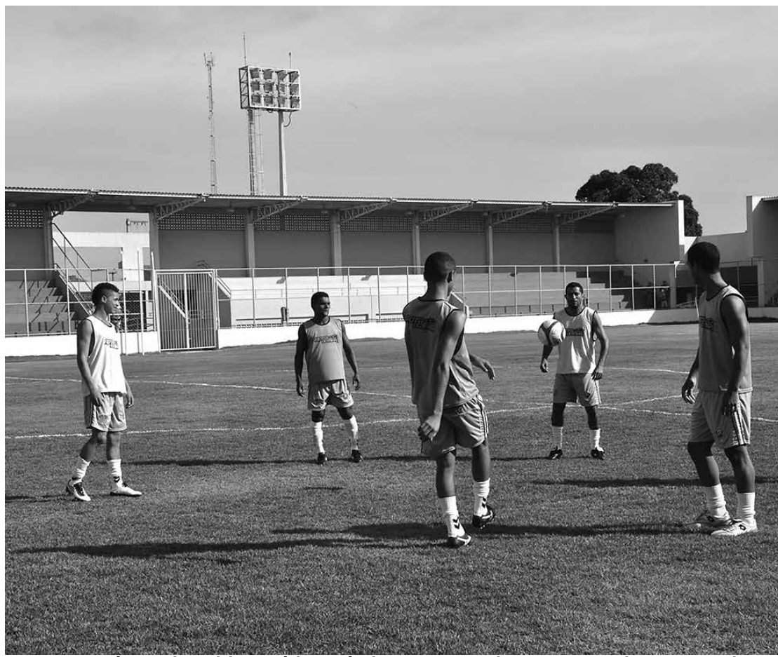
A semana será de muita atividade física e técnica para o CSP visando compromisso em Campina