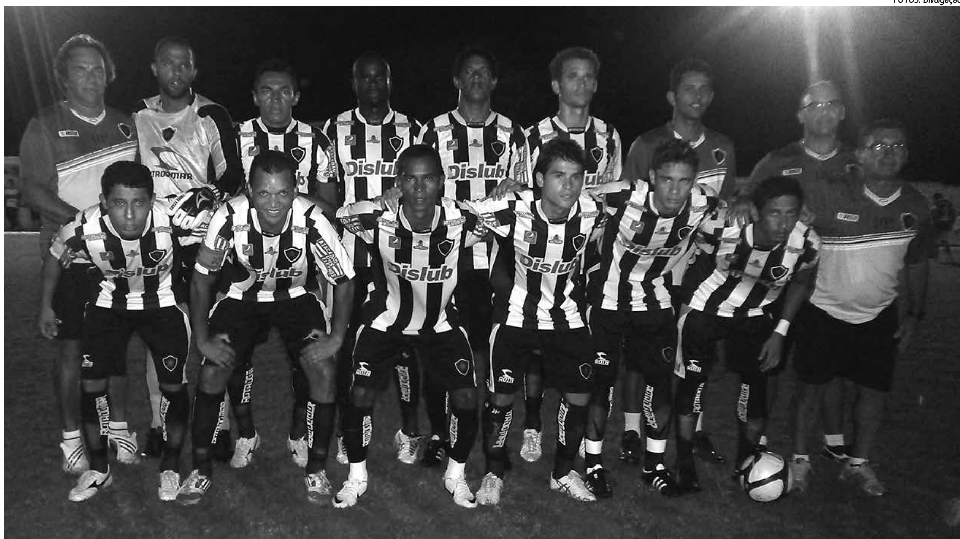
Com nova formação, time do Botafogo realiza amistosos visando a estreia no Campeonato Paraibano, dia 6 de janeiro, contra o Centro Sportivo Paraibano, na capital