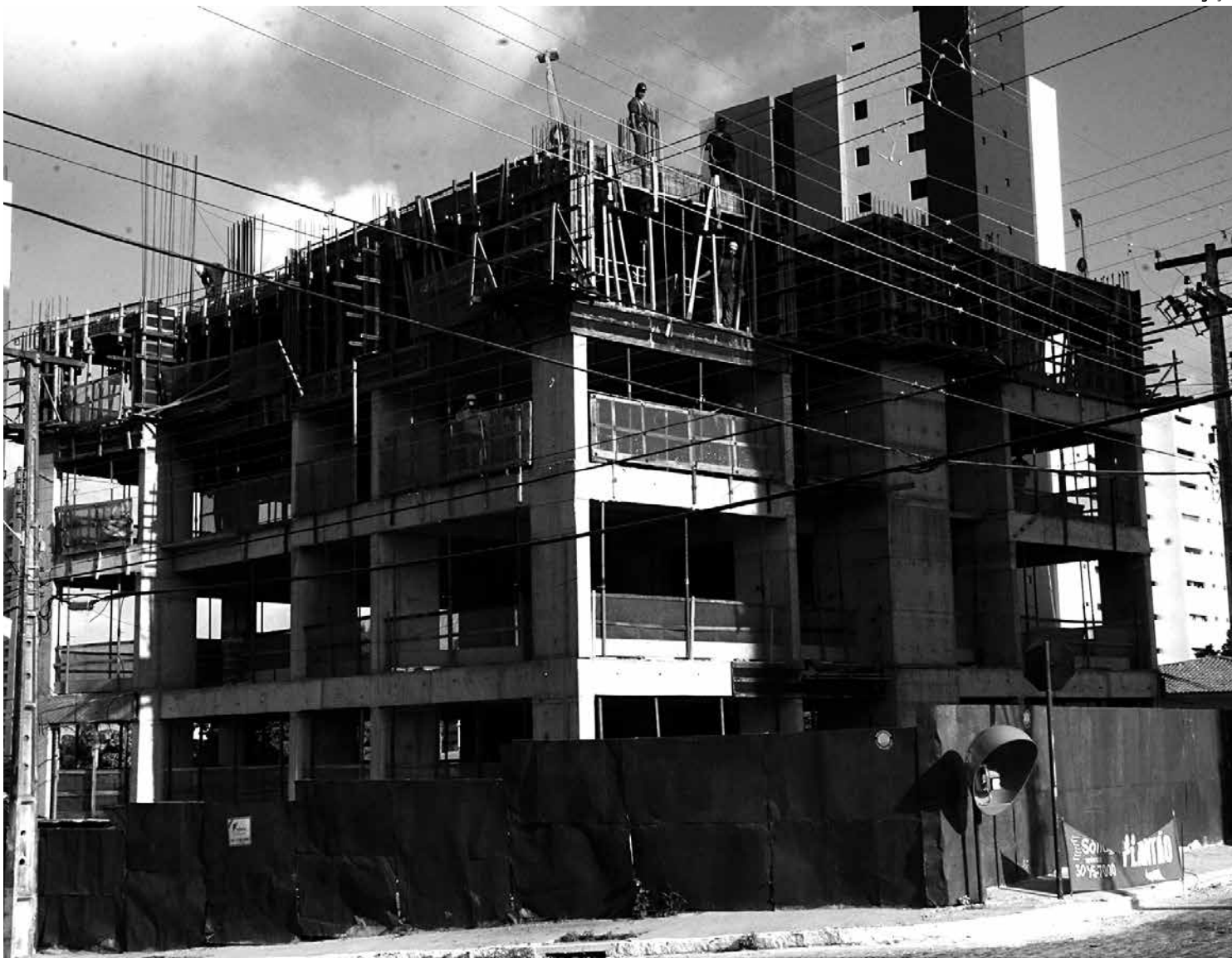
Compra da casa própria tem mais facilidade oferecida pela Caixa que passou a financiar as taxas de registro e de escritura dos contratos

No início de dezembro foi celebrada a entrega de 1 milhão de casas e a contratação de mais 1 milhão pelo programa Minha Casa, Minha Vida. O Programa já fomentou 1,4 milhão de postos de trabalhos formais, e mais de 2.600 empresas contrataram empreendimentos pelo Minha Casa, Minha Vida.