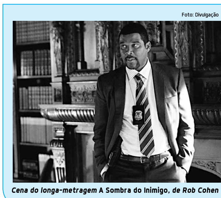
Cena da longa-metragem A Sombra do Inimigo, de Rob Cohen

A SOMBRA DO INIMIGO (Alex Cross, EUA, 2012). Gênero: Suspense. Duração: 101 min. Classificação: 14 anos. Legendado. Direção: Rob Cohen, com Tyler Perry, Edward Burns, Matthew Fox. Alex Cross é um famoso detetive que trabalha em Washington. Após ser informado que um integrante de sua família foi assassinado, ele passa a investigar o caso. Logo descobre que