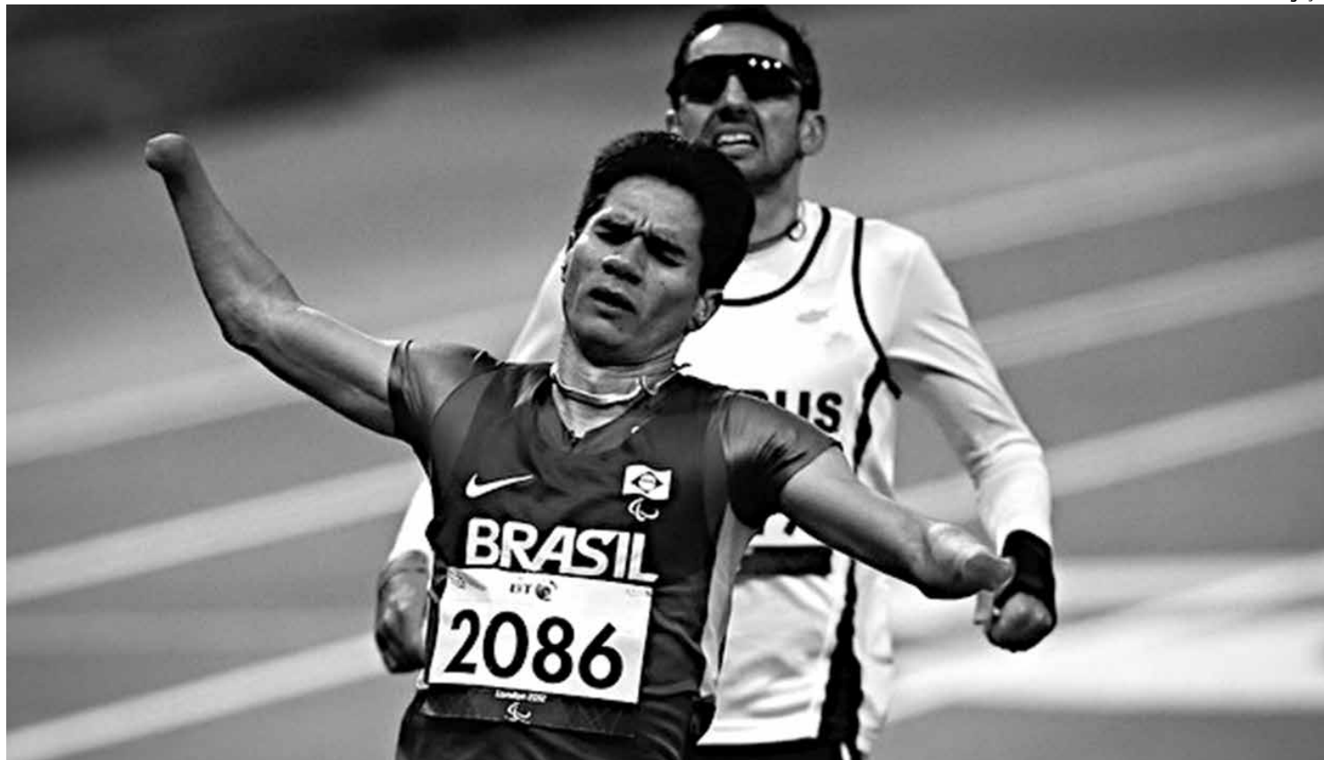
Yohansson Nascimento, recordista mundial nos 200 metros rasos, cumpriu promessa após vencer competição e vai se casar